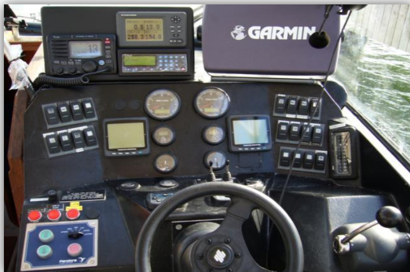
Bild från förarplatsen på en av Kustbevakningens Cobrabåtar.

Telium Pandoras flexibla plattform och enkla handhavande är en perfekt kombination för att kunna leverera system i olika storlekar och anpassade efter varje användares specifika kommunikationsbehov.